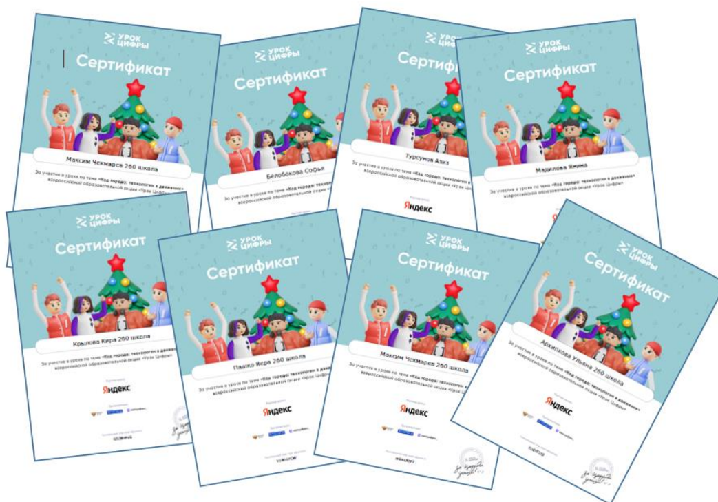
Часть сертификатов участников «Урока Цифры» на тему: Код города – технологии в движении (02-26.12.2024 года)

В этой связи были внесены изменения в отдельные локальные нормативные акты ОО.